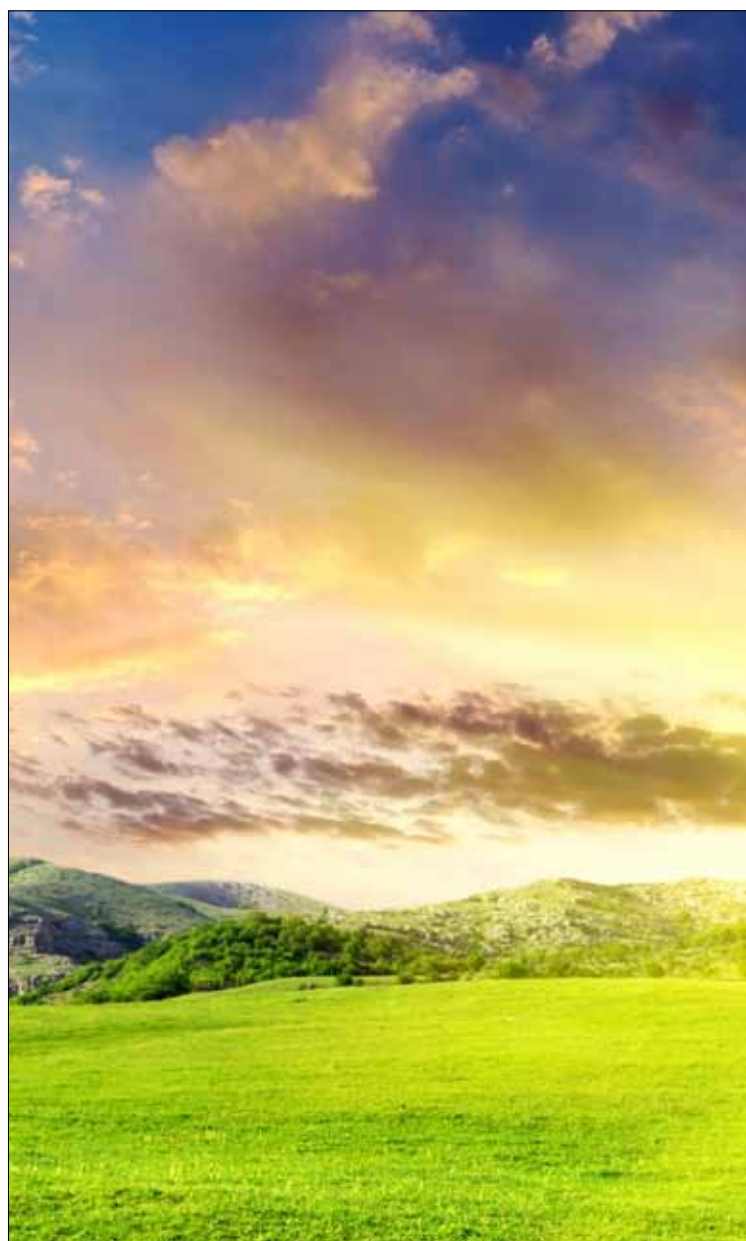
Jord, himmel og hele kosmos skal nyskapes, skriver Harald Avtjern i den

ny jord. For den første himmel og den første jord var borte. (...) Og jeg så den hellige byen, det nye Jerusalem, stige ned fra himmelen, fra Gud, gjort i stand og pyntet som en brud for sin brudgom. Og jeg hørte fra tronen en høy røst som sa: «Se, Guds bolig er hos menneskene. Han skal bo hos dem, og de skal være hans folk, og Gud selv skal være hos dem. Han skal være deres Gud. Han skal tørke bort hver tåre fra deres øyne, og døden skal ikke være mer, heller ikke sorg eller skrik eller smerte. For det som en gang var, er borte.»» (Åp. 21,1; 2-4)