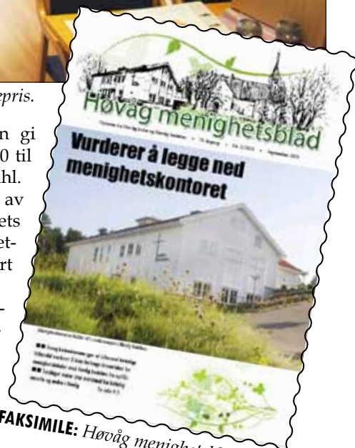
FAKSIMILE: Høvåg menighetsblad sept. 2013